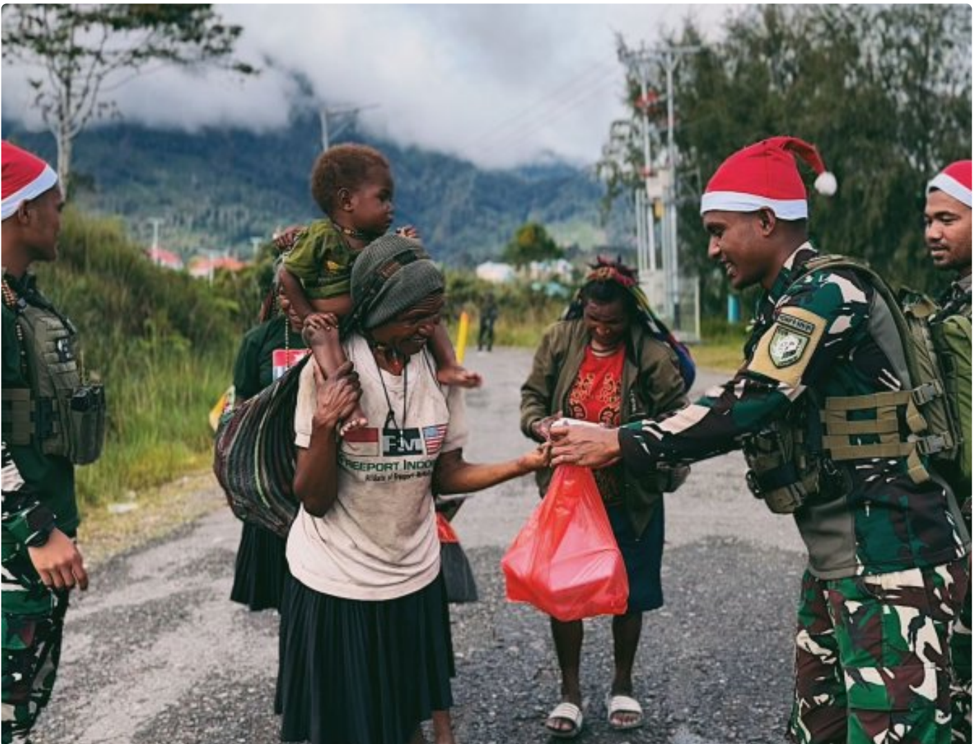
Foto: Satgas Yonif 509 Kostrad memberikan makna baru pada patroli keamanan dengan berbagi kebahagiaan bersama masyarakat di Intan Jaya, Papua.

PAPUA- Dalam balutan semangat Natal yang damai, Satgas Yonif 509 Kostrad memberikan makna baru pada patroli keamanan dengan berbagi kebahagiaan